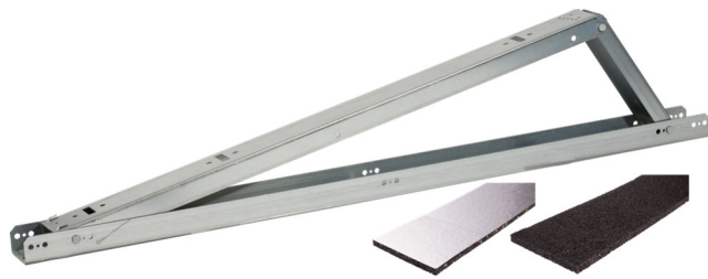
Aufständerung mit BSM mit/ohne Alu-Triplexfolie