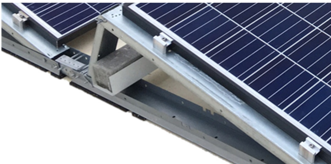
Modulbefestigung: Mittelklemmen-Set + Ausgleichsprofil Beschwerung: Ballastierungswanne mit Steinen