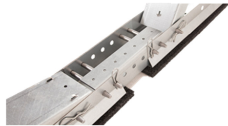
Verbinder-Sets mit Stecksystem