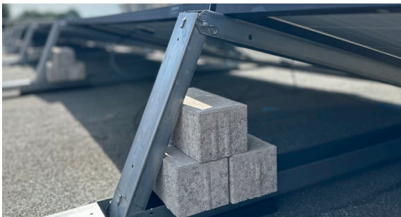
Ballastierung in den TRITON-Aufständerungen