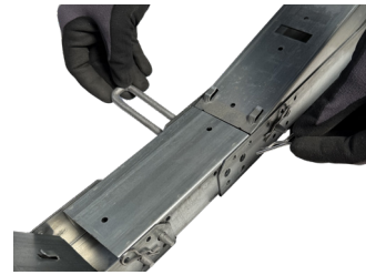
Verbinder-Sets mit Stecksystem