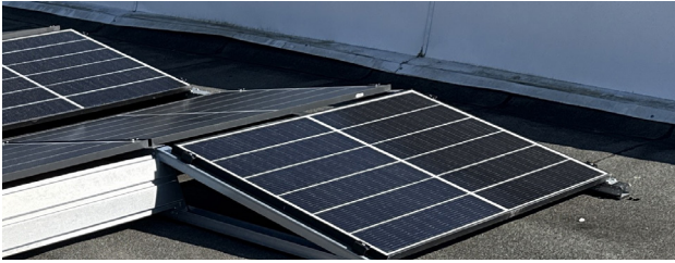
Maximale Flexibilität durch Kombinationsmöglichkeiten Ost-West und Süd

Ein hoher Vormontagegrad garantiert neben einer sicheren und einfachen sowie weitestgehend werkzeuglosen Montage sehr geringe Montagezeiten und -kosten.